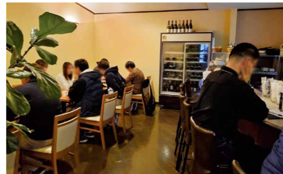
今年も開催予定「X'masパーティ in エポカ」