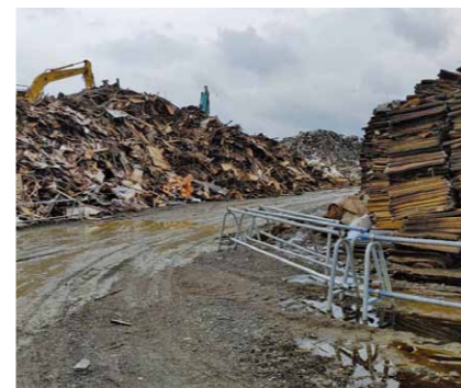
大量に山積みされた災害ゴミ