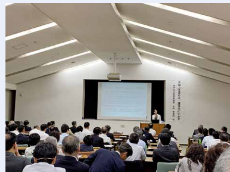
中部十一市議会議員研修会