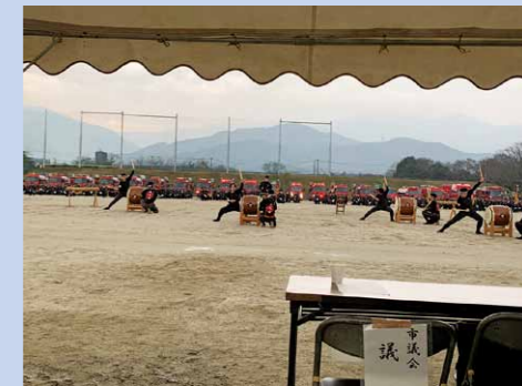
糸島市消防団出初式