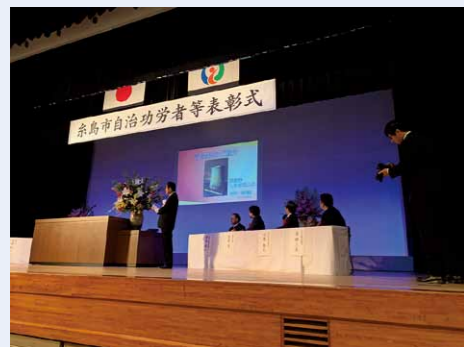
糸島市自治功労者等表彰式