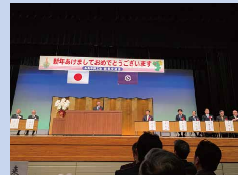
糸島市商工会 新春交流会