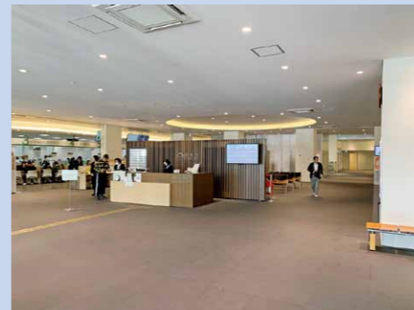
飯塚市視察(婚活支援)