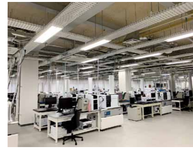
慶應義塾との連携による鶴岡SP

本市でも将来ビジョンを具体的に描き、民間活力を生かしつつ、自由な発想をもつ人材育成をしていけるかが実現の鍵となると考えます。