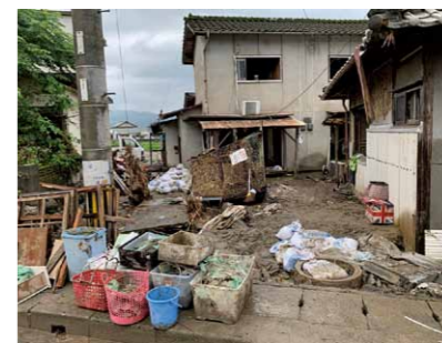
一瞬で日常を飲み込む災害

甚大な被害が出た熊本県人吉市へ、少しでもお役に立てないかとボランティアに行き参りました。