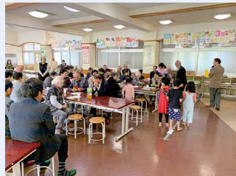
一人暮らし高齢者と協力者のつどい