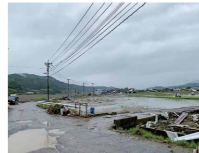
球磨川から越水した堤防付近