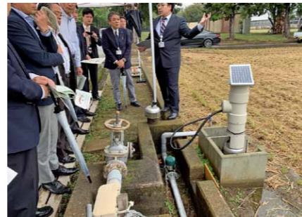
自動制御の圃場水管理システム

しかし、今後の人口減少・少子高齢化を踏まえ、大規模農場化や法人経営など、数十年先を見据えた、農業の在り方について調査・研究を行い、スマート農業の積極的な導入も検討すべきではと考えます。