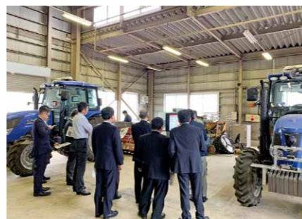
自動走行トラクター見学