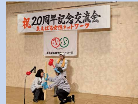
まえばる女性ネットワーク交流会