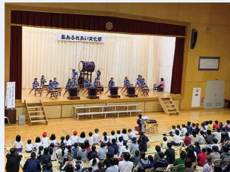
長糸ふれあい文化祭