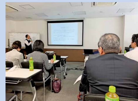
議会改革セミナー(大阪市)