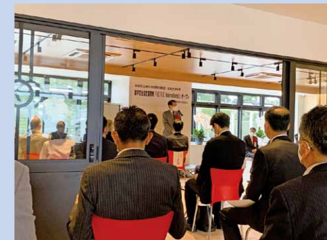
九州大学国際寮オープン式典