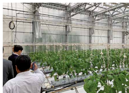
NARO 植物工場つくば実証拠点