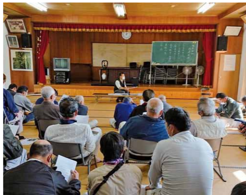
氏子総会にて、再建に向けて議論