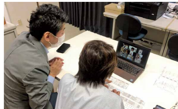
新しい生活様式における婚活(オンライン婚活)

結婚を通じ、市民の幸福度上昇への寄与・本市の主要産業である農林水産業、そして商工業者の後継者不足解消・少子化対策の一助となればとの想いで設立された「いとしま結婚応援団」も活動開始から1年経過しました。