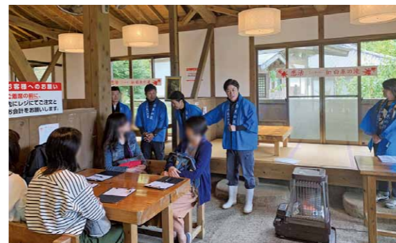
白糸の滝スタッフさん全面協力「恋活 in 白糸の滝」