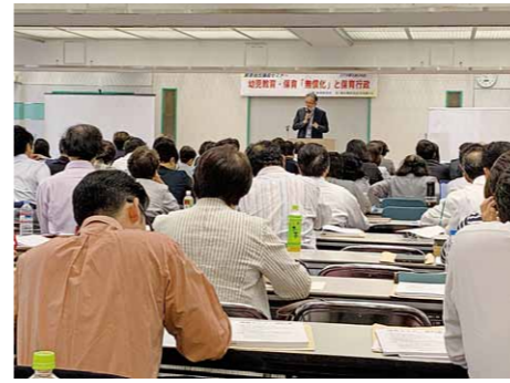
幼児教育無償化セミナー(代々木)