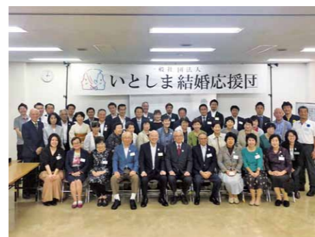
多くの団体・企業の皆様と