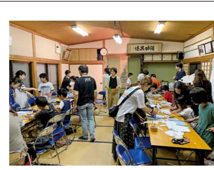
子ども達が作った影絵も登場!