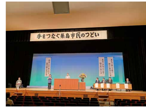
手をつなぐ糸島市民のつどい