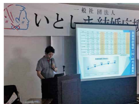
設立趣旨・事業計画のプレゼン