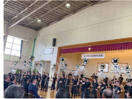
糸島市消防団入退団式