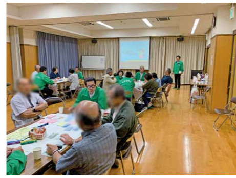
どげんね!?糸島シティミーティング