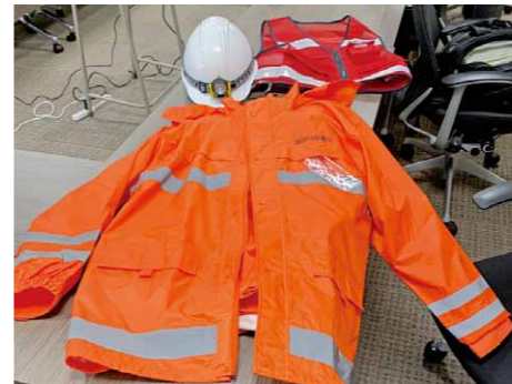
那珂川市議会視察(災害対応)