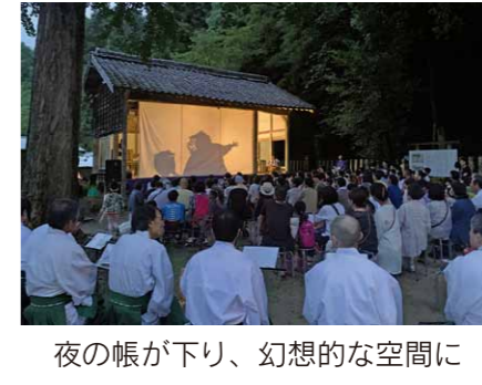
夜の帳が下り、幻想的な空間に