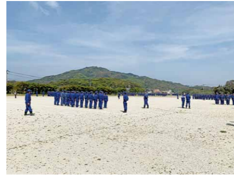
糸島市消防団総員訓練